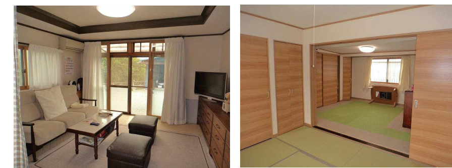
陽当たりの良いリビングと 8帖+8帖の和室