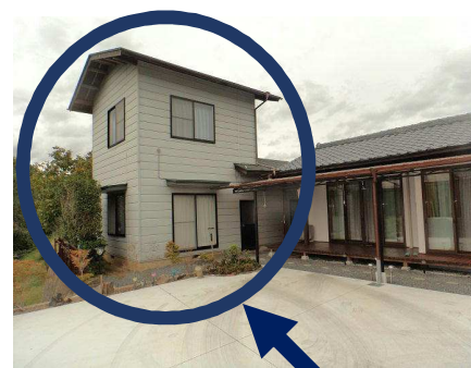
こちらが離れの建物です